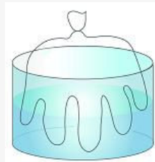
(나) 찬 물에 넣었을 때