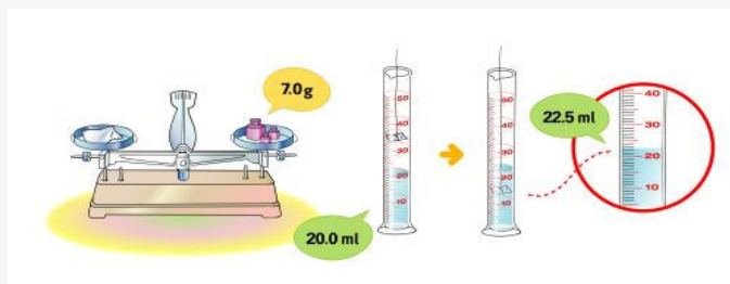
[그림 6-1.2] 알루미늄의 질량과 부피 측정

② 다음은 알루미늄 조각의 질량과 부피를 측정한 결과이다. 알루미늄의 밀도는 얼마인가?